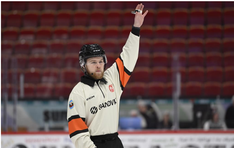
Nya domartröjor togs fram under säsong.