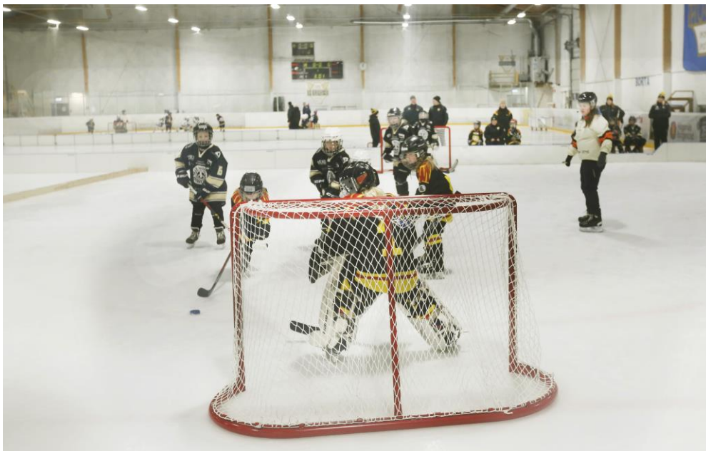
Poolspel tjejer i Kasthallen